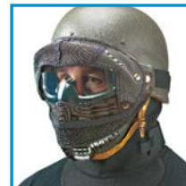
FX ® 9000

NOUVEAU - Masques de protection Simunition ®