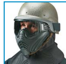
FX ® 9001